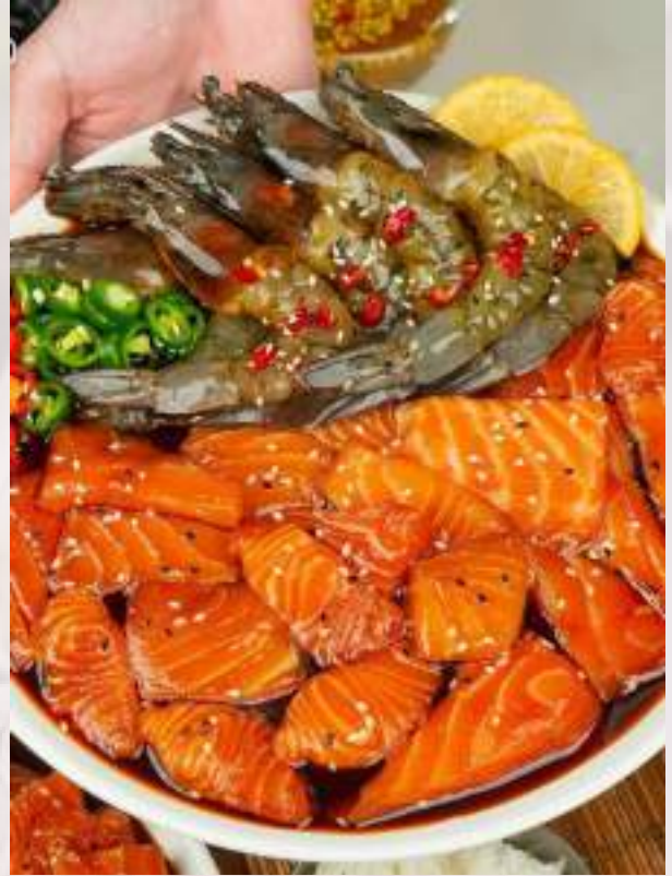
ยำมูมปาก Mumpak サラダ